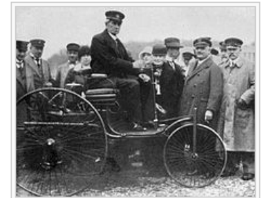
Der 81-jährige Carl Benz auf dem Patent-Motorwagen, Bertha daneben